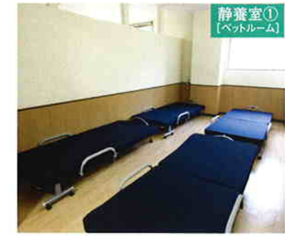
静養室① [ベツルーム]